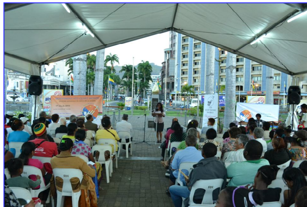
Commémoration au Port-Louis Waterfront

-Promouvoir des espaces de rencontre où des personnes se retrouvent pour lutter contre la misère, les violations des Droits de l'Homme et pour la paix.