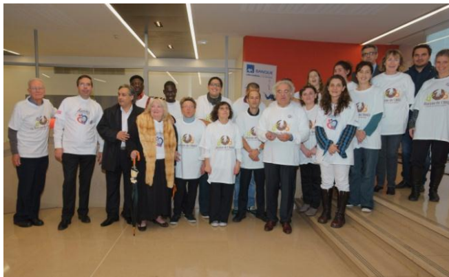
Le groupe de la Maison de l'Amitié et des talents de la rue