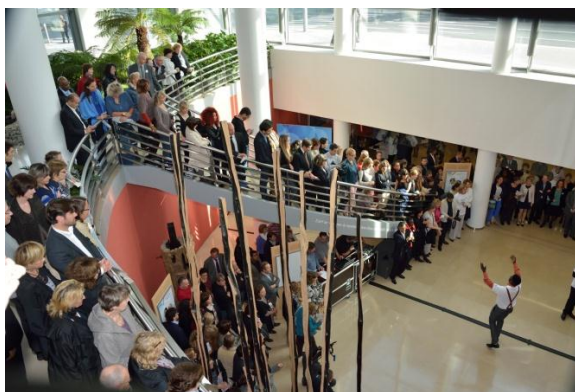
Public AXA France