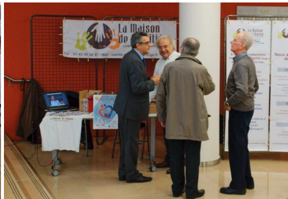
Le stand de la Maison de l'Amitié